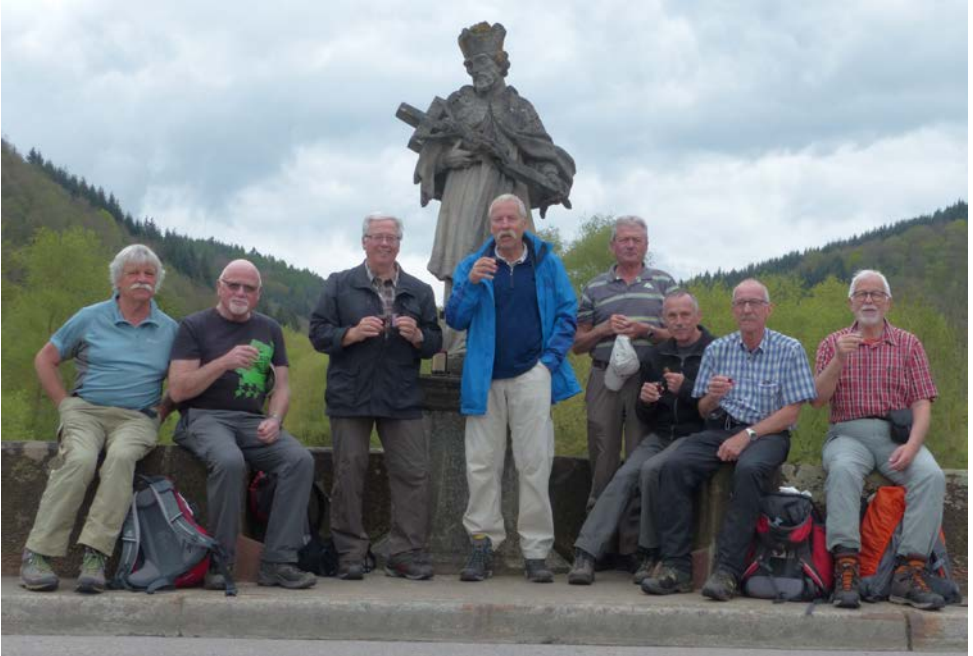
Die acht Wanderer auf einer Brücke über die Tauber

Am Samstag, 29. April begab sich die Wandergruppe mit dem Zug nach Rothenburg ob der Tauber. Beim Badischer Bahnhof gesellte sich, wie schon letztes Jahr, eine Gruppe Männer zu uns in den Wagon, welche den Junggesellenabschied feierten. Der angehende Bräutigam wurde kurzerhand in Mozart verkleidet. Auf einem kleinen Piano spielte er etwas vor und kredenzte uns einen Honig-Williams. In Freiburg gesellte sich auch noch eine Frauengruppe zu uns, welche ebenfalls auf der Jungesellinnen Reise waren. So ging die Fahrt bis nach Karlsruhe wie im Fluge vorbei.