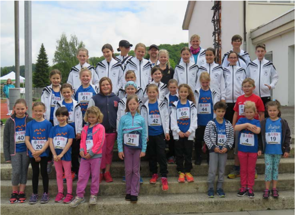
Teilnehmende am Kids Cup in Laupen vom 20. Mai 2017

Wie schon letztes Jahr konnte eine grosse Anzahl Kinder für den UBS Kids Cup begeistert werden. Am Anlass in Laupen waren 28 Mädchen und Knaben am Start. Eine grosse Anzahl Eltern unterstützten sie lautstark.